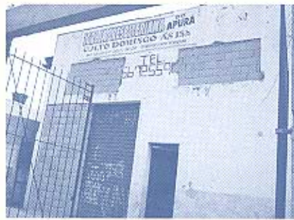
Ingang kerk in Latijns Amerika

U kunt informatie over mijn kerk vinden op http://www.iglesiajesus.com .